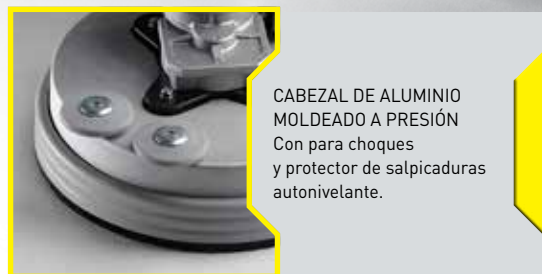
CABEZAL DE ALUMINIO MOLDEADO A PRESIÓN Con para choques y protector de salpicaduras autonivelante.