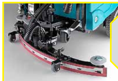
EL SISTEMA DE SECADO está formado por un limpiapavimentos, cuya conformación es fundamental, ya que su función principal es secar el suelo mediante la aspiración del agua. En efecto, es en el secado que se optimiza el trabajo; es decir, cuando se elimina toda el agua sucia, dejando la superficie limpia y brillante. Otros elementos importantes que hemos tenido en cuenta en el diseño de nuestra fregadora son: la elección de los materiales, la forma parabólica, los puntos de regulación.